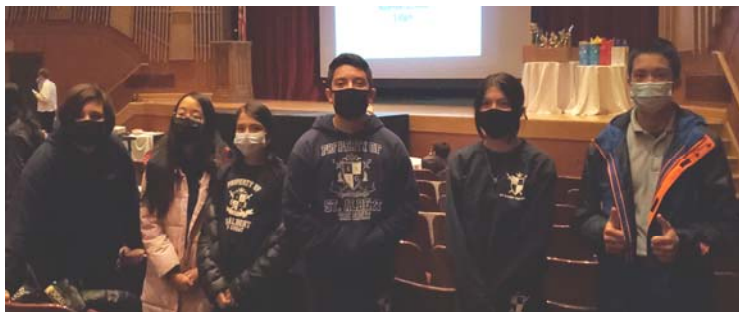
Congrats to our Math team that went to The Fenwick High School Junior High Math Competition.

Send a check to St. Albert the Great school