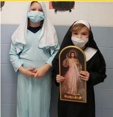
Prek-8th Grade www.stalbertthegreatschool.com