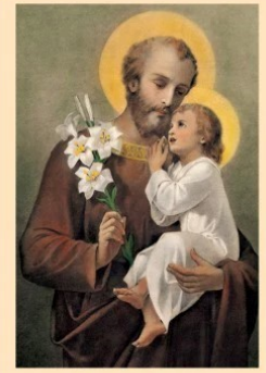
SAINT JOSEPH Pray for Us

Heavenly Father, you entrusted your Son Jesus, the child of Mary, to the care of Joseph, his foster father. Bless all fathers and grandfathers as they care for their families. Give them strength and wisdom, tenderness and patience, give them ability to love in a way that reflects your love. Support them in the work they have to do, protecting those who look to them, as we look to you for love and salvation. Help us to love them in a way that would bring honor to You and them. Bless and heal all those wounded by the imperfections of their fathers and grant an eternal rest to our fathers you have called from this life to yourself, through Jesus Christ Lord. Amen